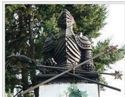
Bustul lui Paul Chinezul în gara Șibot, Alba (1929)

S-a stins din viață în anul 1494 la 24 noiembrie, în timpul unei campanii pe râul Sava, când a fost nevoit să se oprească la castelul Sf. Clement în urma rănilor suferite în timpul asediului cetății Szendrő-Smederevo în Serbia de azi. Corpul neînsuflețit a fost transportat la posesiunea sa de la Nagyvázsony și înmormântat în mănăstirea pe care a ctitorit-o. În anul 1708 mormântul i-a fost profanat, sustrăgându-i-se armura,coiful și paloșa,obiecte ce aveau să reapară mai târziu ,ele fiind adăpostite în prezent la Muzeul Național al Ungariei.