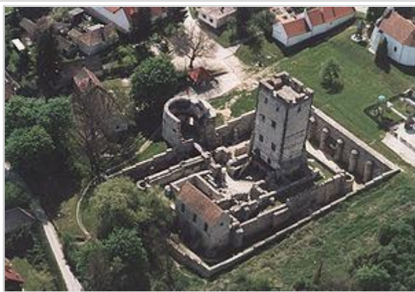
Nagyvázsony - Castelul lui Paul Chinezul