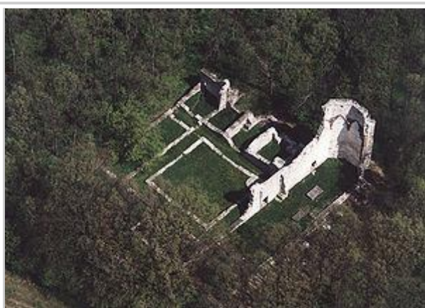
Nagyvázsony - Mănăstirea Paulită